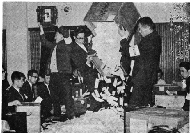
さあ開票、投票箱をあける市職員