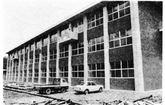
第1期工事を完了した開成中学校の校舎

第2期工事が終わりますとすぐに第3期工事の体育館にかかり、昭和50年度いっぱいには全部完成する予定です。