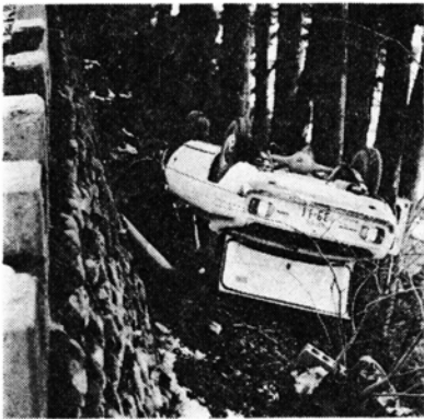
ちょっとした不注意で大事故に