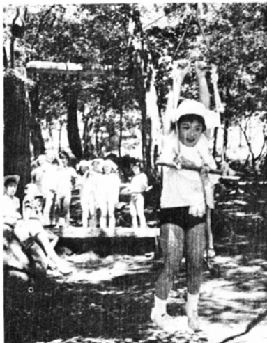
人間ケーブルで遊ぶ子供たち

ナラ、ミズキ、杉などの木立ちの中に赤、青、黄のテントが点々と張られ、こずえからはウグイスや山ガラのさえずりが心地よく聞こえてくる奥越青少年の森