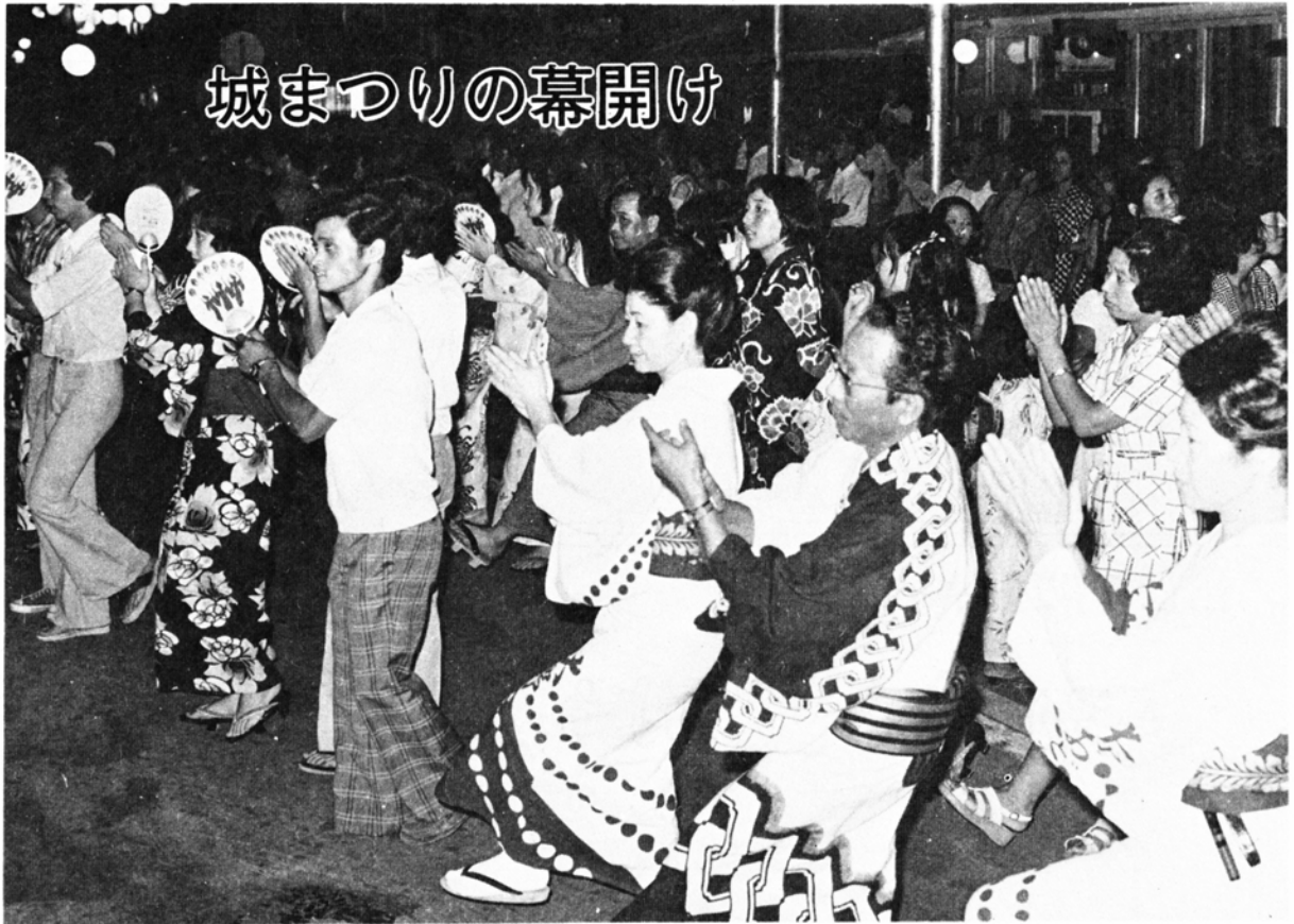
城まつりの幕開け

出生 男 19 女 24 計 43 死亡 〃 13 〃 18 〃 31 転入 〃 36 〃 33 〃 69 転出 〃 39 〃 42 〃 81 世帯数 10,325(前月+9) 人口 42,649(前月±0) 男 20,591 女 22,058