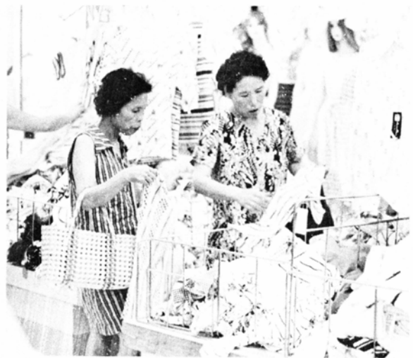
安くて良い品物を買おうと懸命に選択する主婦

果を分析して①ムダ使いが目立つ②家計簿をつけていない③物を再利用する工夫が足りない——などの点を指摘し、今後婦人会その他の外部団体の話し合いなどで消費生活に関する反省材料の資料に供するほか、賢い消費者づくりや貯蓄推進運動にも役立てていきたいとしています。