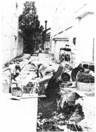
工事が進む本町下水路 (大野織物工業協同組合横で)

特に交通事故による出動が28件で前年より15件少なくなり、反対に急病が5件多くなっています。