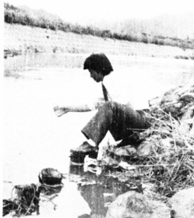
採水する調査員 (赤根川で)