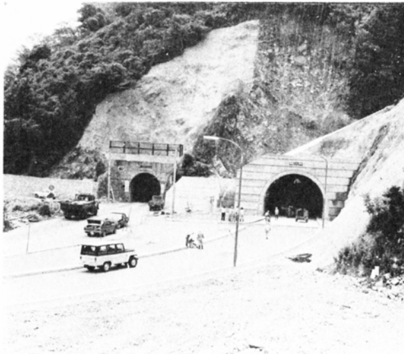
完成した2車線の「馬返しトンネル」左は旧トンネル

このあたりは今昔変わらぬ景勝地で、新トンネルを抜けるとそこには奇岩、絶勝の「魚止」、そして暑さ知らずの「仏御前の滝」それに満々と水をたたえた「仏原ダム」などがあります。新しいトンネルの開通を機会にぜひ一度九頭竜峡をお訪ね下さい。