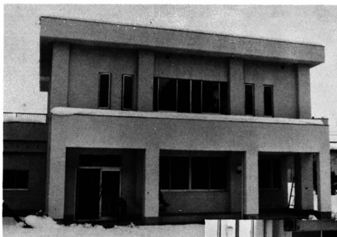
▼明るい農産物加工室 正面から見た婦人の家

農村婦人の家は、農家の婦人が生活改善をはじめ健康増進や農産物の加工など、生活に密着した活動の拠点として利用するための施設です。