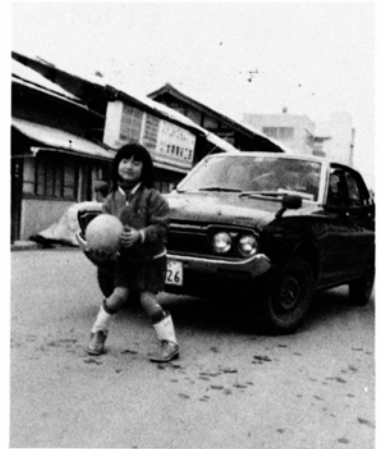
危ない路上での遊び

忘れ物をして途中から引き返したりすると、非常にあわてるため注意力が散漫になり事故のもとになります。