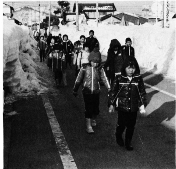
整列して集団登校をする児童