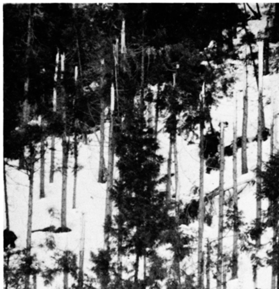
雪折れがひどい杉林 (亀山裏の市有林)

ここ数年、年末・年始は雪が少なく穏やかな正月を迎えていましたが、今冬は12月26日から強い寒気団が南下し激しい降雪に見舞われました。特に28日夜から29日の朝にかけては1夜に115㍉もの降雪があり、交通機関も完全にマヒ。1月14日には積雪264㍉に達し市民は連日白魔との闘いになりました。1月20日過ぎからは天候も落ち着きを見せ、しだいに明るさを取りもどしましたが、今冬は降雪が早かったため雪質が重く、山林の倒・折損被害や農業用ハウスの倒壊など農林業関係にも大きなツメ跡を残しました。