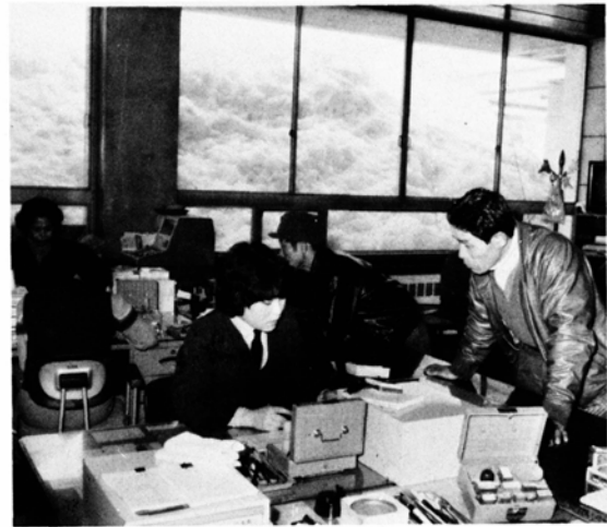
窓口係に申し込む市民

春は進学・就職・転勤のシーズンです。転入・転出や保険の加入・離脱などの届け出はもうお済みですか。この時期は窓口が込み合いますので、必要な書類をお確かめのうえ早目にお越し下さい。今月は、市民課窓口（6-1111内線 261）についてご案内しましょう。