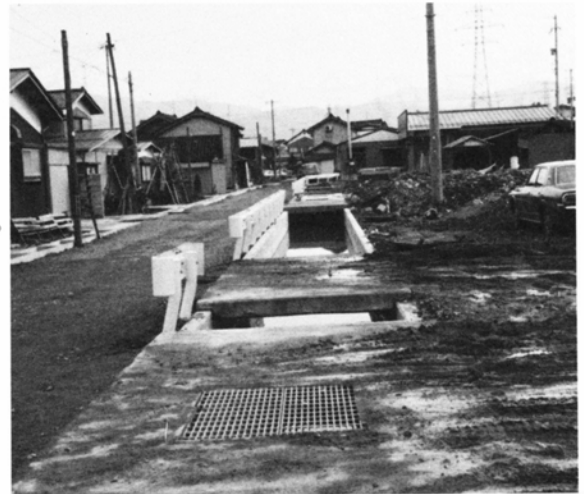
改修された下水路(中挾)

これまで中挾地区は雨水などがはららんし、道路や住宅が浸水することが度々ありましたが、今後はその心配もなくなります。