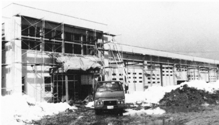
内装工事が進む格納庫