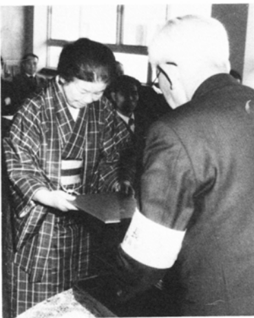
当選証書付与式 (2月14日)