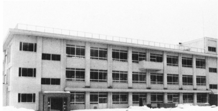
明るくモダンな新校舎

外装で仕上げられたモダンな建物です。普通教室棟、管理棟・特別教室棟、給食室棟があります。