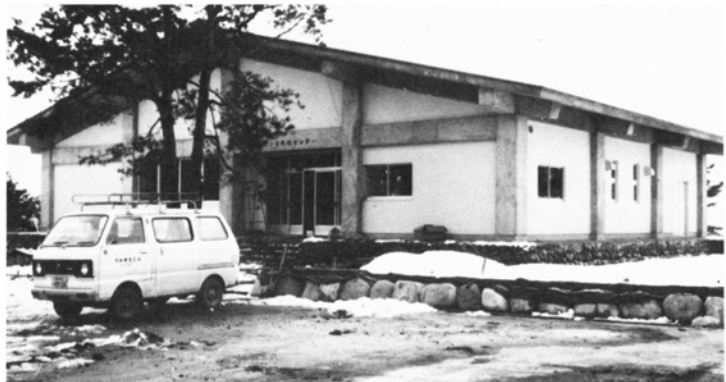
オープンを待つ公園センター

来年度以降は、自然探勝区の妻平池ヶ原を結ぶ遊歩道の建設を中心に事業を進める予定です。