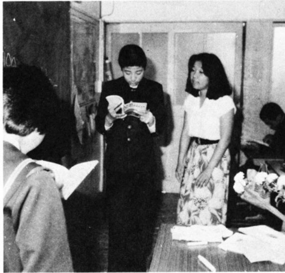
先生と熱心に学習する生徒たち(上庄中)

での授業は、生徒たちにも大好評です。「授業では、ほとんど英語しか使いません。生きた英語を知ってもらい、興味を持ってもらえれば…。こちらの生徒は文法知識や読解力は相当あると思いますが、会話力はいま一步です。これは練習の場がほとんどないのも原因でしょう。気質はみんなまじめで素直ですね。でも、