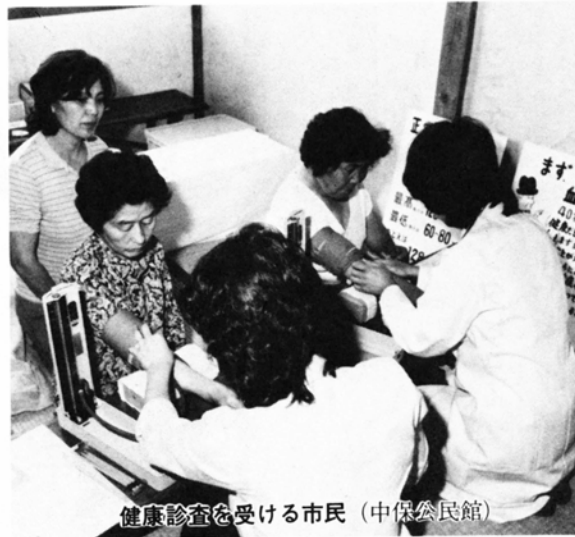
健康診査を受ける市民（中保公民館）