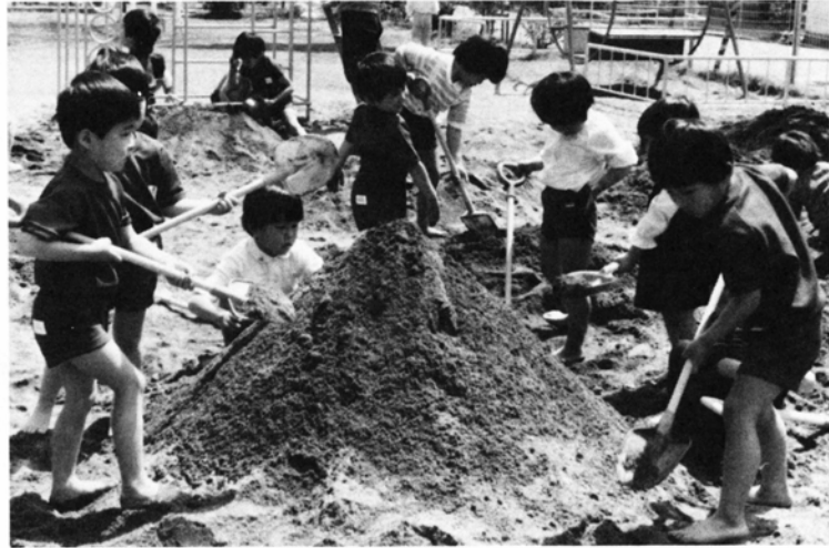
伸び伸びと遊ぶ幼児たち

所長 いいえ、違います。市では改正の際、保育料徴収基準審議会を開いて、内容を十分検討してもらったうえで決定しています。この審議会は、保護者の代表をはじめ保育所関係者や学識経験者ら12人で構成され