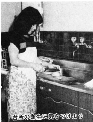
台所の衛生に気をつけよう