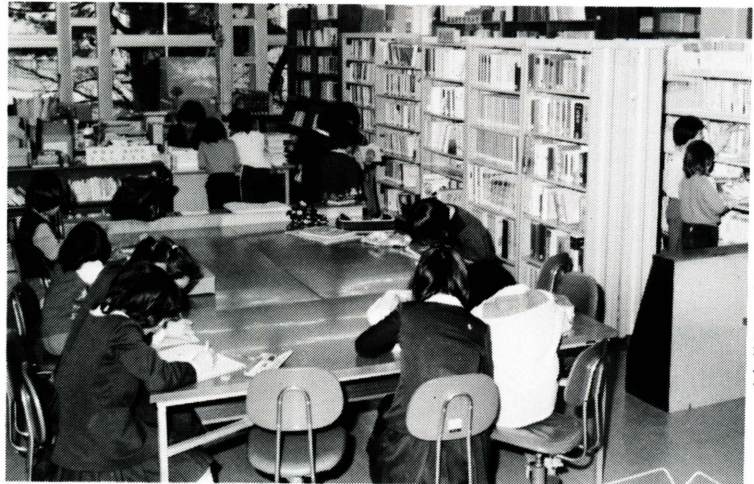
改築が待たれる現在の図書館