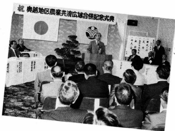
◀ 四月一日 奥越農業共済事務所が発足（写真は四月二十五日の祝賀会）