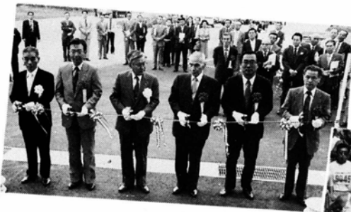
◀9月30日 サン・スポーツランドが六呂師高原に誕生