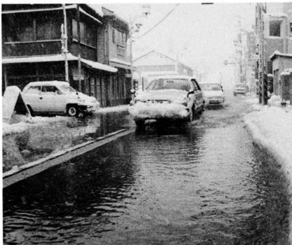
毎年、水つきのトラブルが多発

しかし、せっかくの流雪溝も、正しく使わないとトラブルの原因に……。自分勝手な行動は慎みま