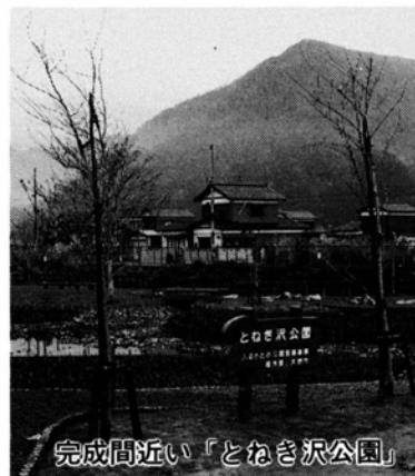
完成間近い「とねき沢公園」

寄りまでが気軽に水と緑に親しめるようになっています。遊歩道やベンチを備えているほか、木々や芝生・花ショウブなども植えてあります。