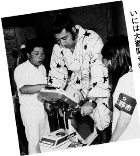
◀七月二十七日 健康づくり市民のつどいには大関も特別参加