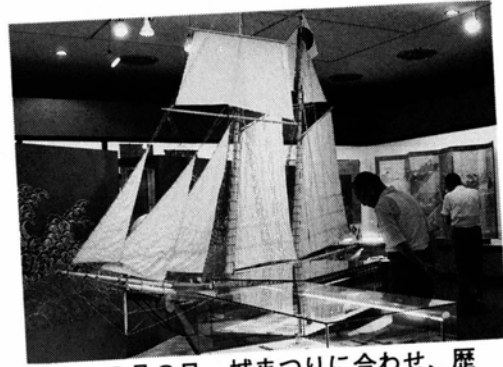
▲8月8日 城まつりに合わせ、歴史民俗資料館・産業文化展示館がオープン