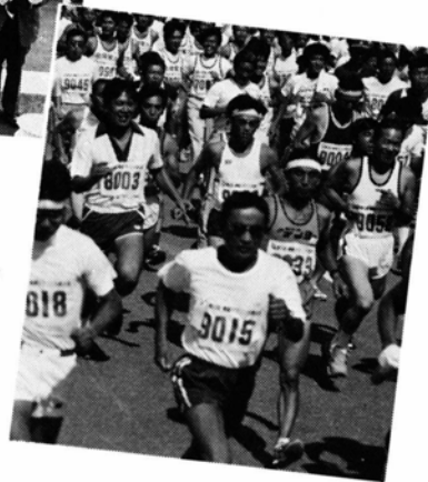
▶10月5日 3年ぶりに大野で開かれた奥越マラソンには県内外から749人が出場

ませんが、いい施設だと思えます。現代社会は、古い物を捨て去るのが美德のように考えられているようです。貴重な建物や民具などが簡単に取り壊され、捨てられるのは断腸の思いです。オープンを機に、先人の苦勞や功績をしのぶとともに、古き良き物を大切にすることを期待しています。