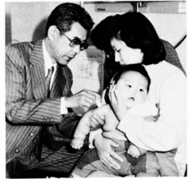
保健センターでの予防接種