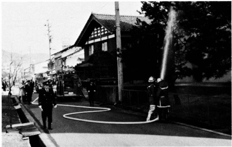
春季消防総合訓練