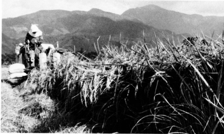
良質米の生産に励む農家