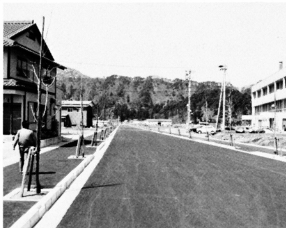
間もなく開通する鍛掛・新庄・東中線