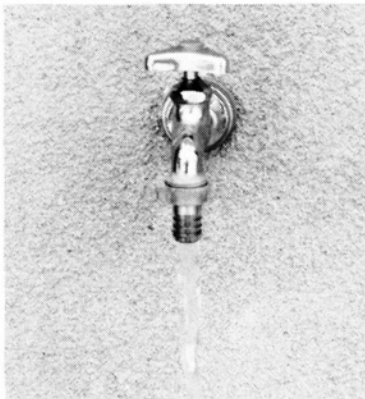
限りある水質源を大切に