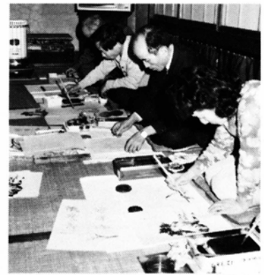
公民館で行われている各種講座