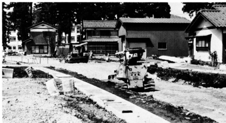
街路整備が進む市街地