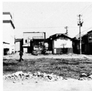
12㍍道路になる駅前・清滝線

62年度以降は工事に取り掛かり、65年度に完成の予定です。総事業費は5億2,800万円を見込んでいます。