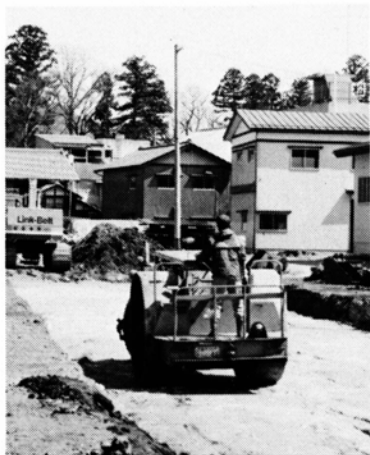
道路築造が進む上中野線