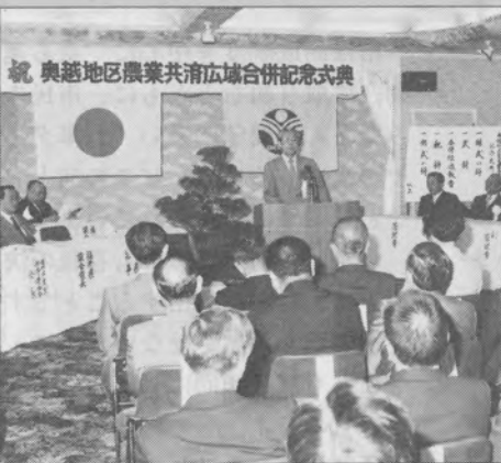
統 奥越地区農業共済広域合併記念式典