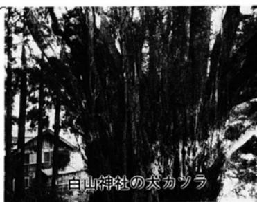
白山神社の松蔵ツラ

打波川と支流の谷山川の合流点に、昭和48年までは学校がありました。今は碑だけが残っていますが、川を上っていくと出作りがあり、一番遠い奥の平までは10キロあります。さらに進めば和泉村に