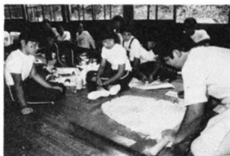
手打ちそばの実演も

第3回「大野カントリースクール（OASIS協会主催）」が7月26日～29日、旧勝原小校舎で開設されました。大阪市などから小学4～6年生76人が参加、自然の中で交流を深めました。