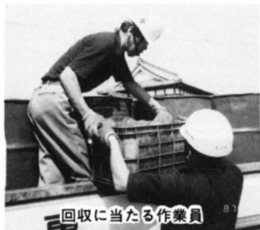
回収に当たる作業員

この空きビン回収は、8月以降(冬期1・2月を除く)も毎月17～27日の11日間、日曜日や祝日・振