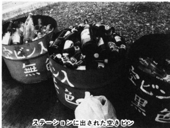
ステーションに出された空きビン

●ビンに付いている王冠やキャップは事前にとりはずし、空ビン回収とは別に指定された不燃物ゴミの収集日に出してください。