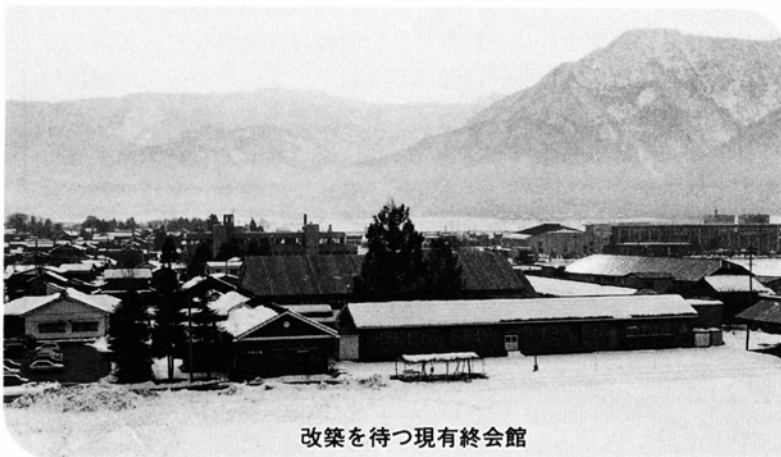
改築を待つ現有終会館

現在の大野高校の敷地は、環境的には大変よい場所ですが、総面積が3万平方メートル（約9,000坪）にも満たず、文部省基準の半分以下となっています。こうした点を踏まえ、今後とも移転に必要な校地