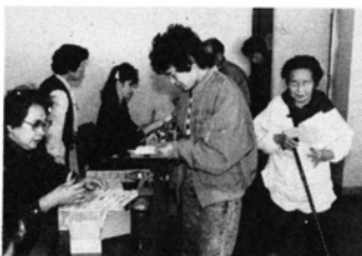
心の温もり 贈ります

市歳末助け合い募金の配付が昨年末に行われ、市民から市社会福祉協議会へ寄せられた義援金など295万2,000円が、寝たきり老人や施設入所中の人など1,227人に贈られました。