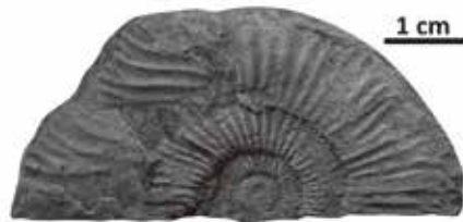
発掘調査で発見されたアンモナイト化石

今回の発掘調査では、4種類のアンモナイトが発見されました。発見されたアンモナイトの種類から、石徹白川河川敷には中期ジュラ紀前期カロビアン期(約1億6600万年前)に海で堆積した地層が存在することが明らかになりました。