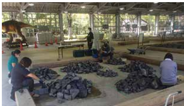
HOROSSA!で調査する大野化石調査隊

中部縦貫自動車道大野油坂道路の建設工事で掘削した岩石から、さらに多くの化石が発見されることが予想され「世紀の大発見があるかも」と、多くの人に関心を持っています。令和元年10月からは化石調査ボランティア「大野化石調査隊」が化石発掘体験センターHOROSSA!で岩石を調査しています。