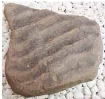
伊月化石壁で発見された漣痕が表面に残る岩石