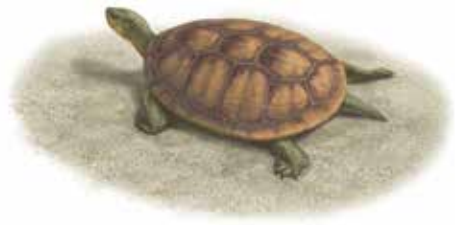
マンチュロケリスの復元図(提供：おさとみ麻美)

本市で発見されたマンチュロケリスは新種の可能性があります。発見された部位が少なく証拠が十分ではないため、今後の新たな追加標本の発見が待たれます。