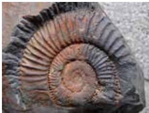
シュードニューケセ ラス・ヨコヤマイ

世界で唯一、本市のみで発見されているアンモナイトです。近年では中国チベットでも、よく似た種類のアンモナイト化石が発見されています。