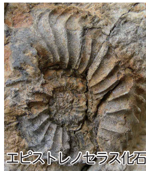
エピストレノセラス化石

栃餅山(標高882.9m)は、和泉地区の下山、板倉、朝日、貝皿にわたり広がる山域にあり、中期ジュラ紀の地層である九頭竜層群が隆起してできた山です。エピストレノセラス化石は、これまでアンモナイト化石が報告されていない栃餅山の南方で発見されました。