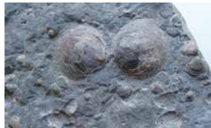
伊月化石壁で発見された二枚貝化石