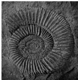
本市で発掘されたアンモナイト化石

アンモナイトは約6600万年前に絶滅してしまっただけで、生きていたときの姿はほとんど知られていません。アンモナイトの化石として残るのは殻の部分です。殻の形から巻貝の仲間であると誤解されがちですが、現在生きているアンモナイトの仲間(頭足類)としてはイカやタコ、オウムガイがあげられます。