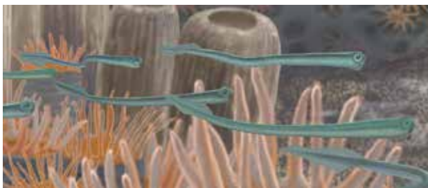
コノドントを持つ動物の復元図

コノドントは、約5億年前(カンブリア紀後期)～約2億年前(三疊紀末)の地層から見つかる動物の一部の化石で、とても小さく歯のような形をしています。コノドントを持っていた動物の正体についてはさまざまな説がありますが、細長いウナギのような姿をした動物だと考えられています。