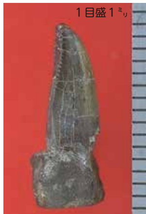
下半原で発見されたティラノサウルス類の歯化石 (和泉郷土資料館で展示中)

ティラノサウルス類の化石は、他に、国内では北海道、岩手県、福島県、石川県、兵庫県、長崎県、熊本県で発見されています。本市で発見された化石は、その中でも時代が古く、 日本最古級 になります。