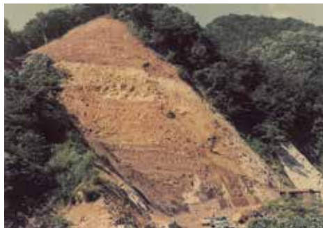
昭和55年頃の伊月化石壁

九頭竜川支流の石徹白川に沿って通る県道127号線(白山中居神社朝日線)にある後野ロックシェッドの上には、「伊月化石壁」と呼ばれている大きな崖があります。これは前期白亜紀の手取層群伊月層(約1億2700万年前)の地層です。シジミやカキなどの貝化石や れんこん 漣痕(波が水底につくった模様)が表面に残っている岩石が見つかるため、伊月化石壁の地層は海水と淡水とが混じる塩分が低い河口付近などの場所で堆積したことが分かります。過去には、恐竜の足跡化石などが発見され、注目を集めました。