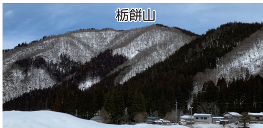
化石発掘体験センター HOROSSA! から望む栃餅山