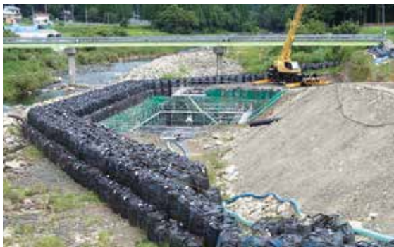
石徹白川橋建設工事(平成30年8月20日撮影)

本市と県立恐竜博物館は、平成30年4月～11月、中部縦貫自動車道大野油坂道路の石徹白川橋建設工事(本市貝皿)により排出された岩石を対象に発掘調査を実施し、アンモナイトや二枚貝の化石を発見しました。