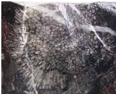
ハチノスサンゴの仲間