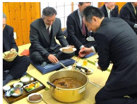
「おおの遺産」(土布子区の伊勢講)