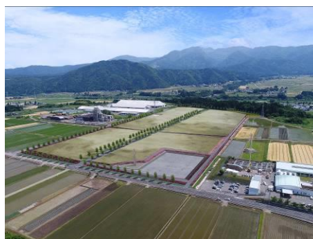
大野市富田産業団地