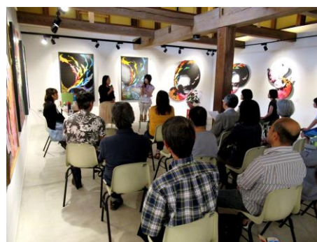
COCONOアートプレイス企画展