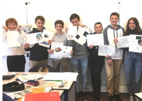
フランスとの交流