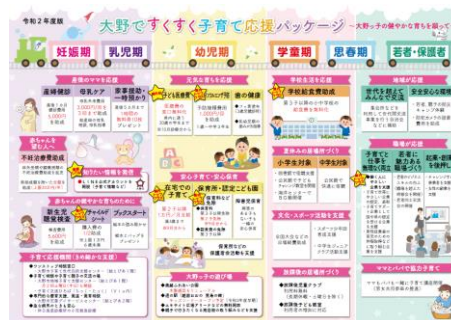
「大野ですくすく子育て応援パッケージ」