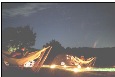
六呂師高原での「星空ハンモック」