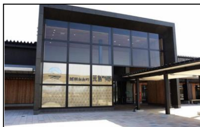
道の駅「越前おおの 荒島の郷」の整備