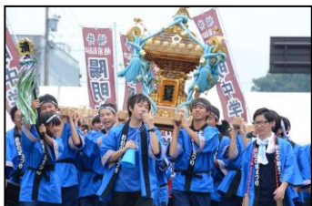
中学生みこしダンスパフォーマンス