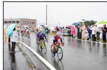
福井しあわせ元気国体・元気大会