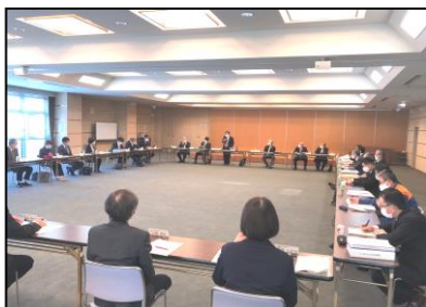
人口減少対策会議の開催