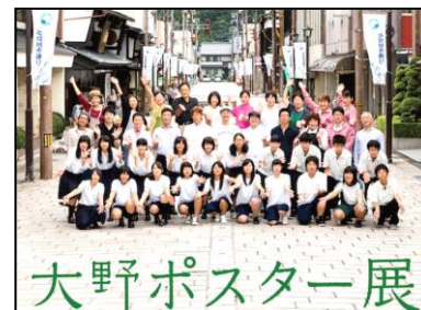
大野へ帰ろう事業