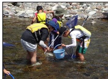
越前おおの環境塾