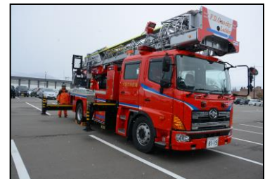
消防車両の整備・更新