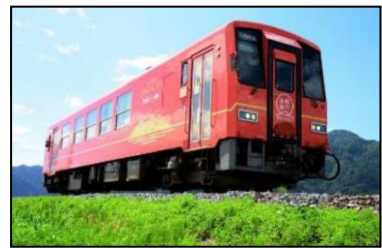
JR越美北線の利用促進