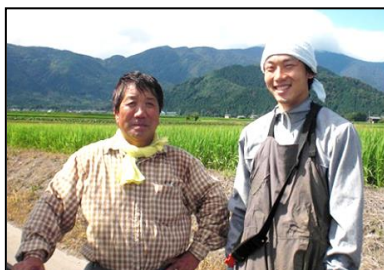
移住体験プログラムの提供