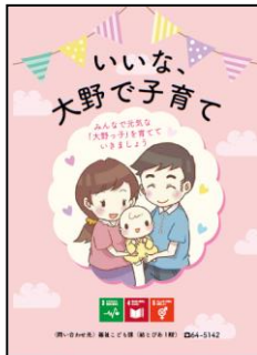
大野ですくすく子育て応援パッケージ