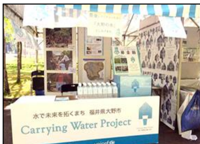
水への恩返し Carrying Water Project