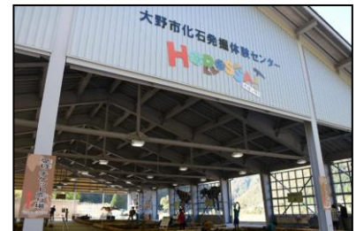
化石発掘体験センター「HOROSSA！」