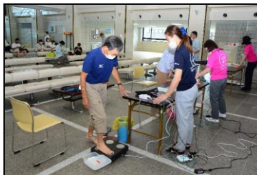
おおのヘルスウォーキングプログラム