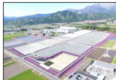
整備した大野市富田産業団地