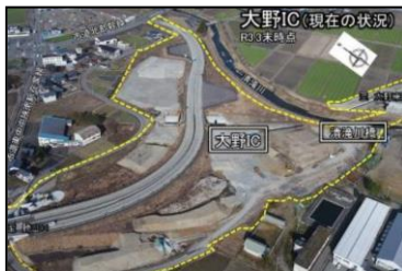
中部縦貫自動車道の整備促進