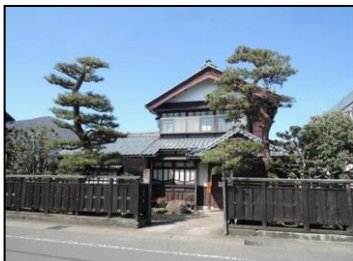
越前おおの水のがっこう