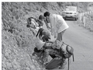
のりのり作りの 場のグリーン広場 のグリーン広場の どんぐり拾い

答 具体的な事業は、越前おおのの自然や観光資源と農林産物を融合させた新たな農林産物加工品の開発、自然や観光資源をエコ・グリーンツーリズムの素材として活用するための里山体験の企画開発、越前おおののさまざまな特産品や観光資源などの魅力情報を集約させたカタログの作成・試験販売などである。