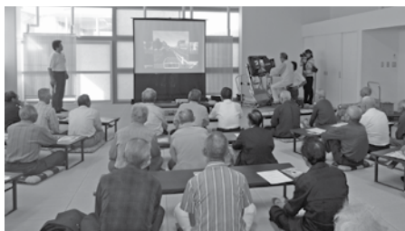
シミュレーターでの自転車模擬運転

答 に対する事故防止対策等の啓発状況は。市内の中学校では原則的に初雪以降は自転車通学を禁止している。一般市民に対しては、9月に自転車シミュレーターを使った自転車模擬運転の体験などで安全運転の意識を高め