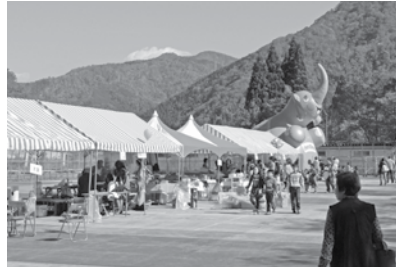
九頭竜紅葉まつり「遊びの広場」

A 今、国道157号線の整備に伴って、菖蒲池踏切を拡幅することで合意している。この改良計画があるので、その他の踏切については、今は拡幅できないとJRから回答を得ている。その後の計画としては、藤甲踏切（牛ヶ原）の改良についておおむね合意を得ている。その他2カ所ほど拡幅したい踏切があり、藤甲踏切改良後に拡幅するようお願いをしているところである。