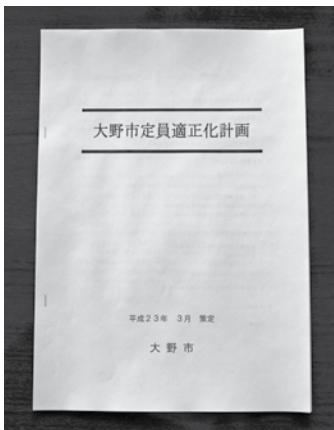
大野市定員適正化計画 (第五次)

市職員の定年延長は、平成25年度から段階的に定年年齢を引き上げ、37年度には定年年齢を65歳とするものであり、国等の動向を見ながら、25年度以降に対応する。また、再任用制度は、現段階では運用していない。