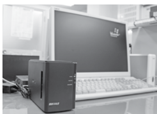
各課保有のハードディスク例

正かつ効率的な管理、運用基準を定め、職員に対し情報セキュリティ研修を行い、情報漏えいに対する意識啓発を行っている。ウイルス対策としては、ソフトウェアを導入し日々の更新を行っている。バックアップは各課にあるハードディスクで行っているが、平成23年度末からファイルサーバーを導入して一括して行える体制を整えている。