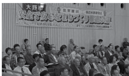
大野市安全で安心なまちづくり推進大会

る各学校での取り組みは、どちらかというと大人が主力になって作っているの で、子どもの目線、子どもの危険察知能力の育成という部分では若干欠けている部分があるかと思っ てい る。