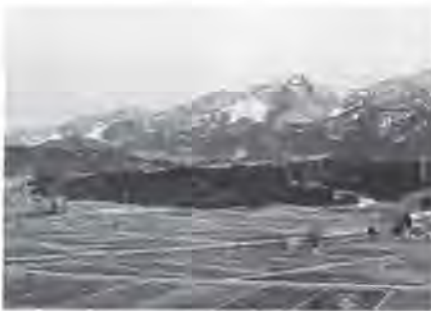
雄大な自然の有効利用を

全財政の堅持に心掛けたい。来年度では大きな事業がたくさんあるのも事実であるが、無駄のないように金を使い、最大の効果を上げることが基本として努力したい。