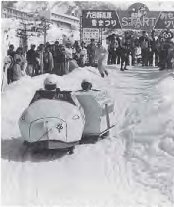
雪の祭典、昨年の六呂師高原雪まつり