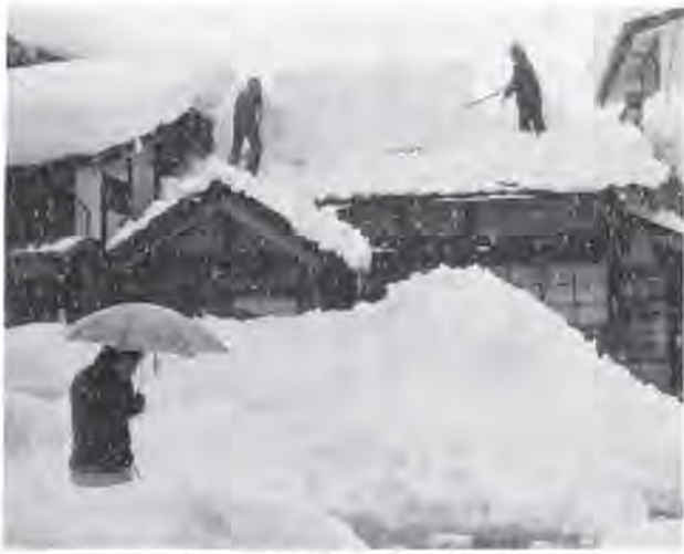
老人には無理な屋根雪下ろし

答 自宅の屋根雪下ろしなどを自分でできないと思われる一人暮らし老人や、社会的に弱いと思われる所帯については、事前に親戚や身寄りの方や近隣の方々に対してお願しておきたい。諸事情で援助が期待できない所帯に対しては、その費用等については市で対策したい。