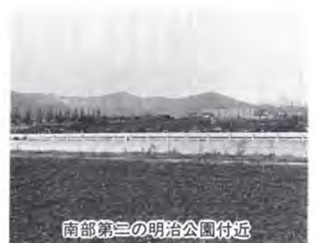
南部第三の明治公園付近