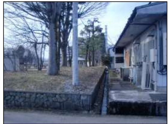
図 1-3 新文化会館整備予定地（現駅東公園敷地）の写真