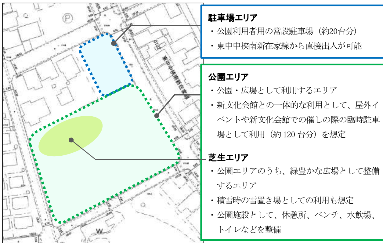
図 2-2 新駅東公園の整備方針図