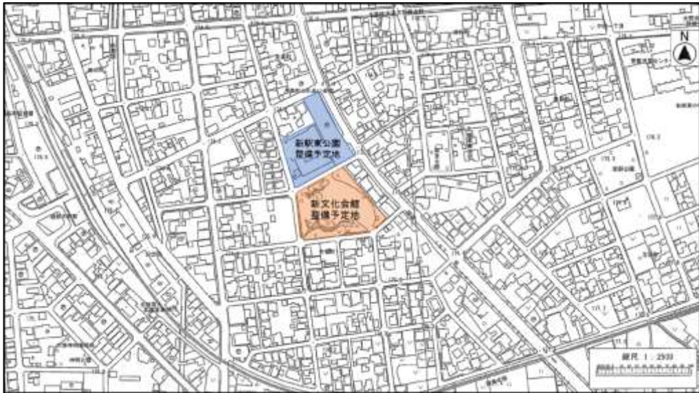
図 1-1 事業予定地の位置