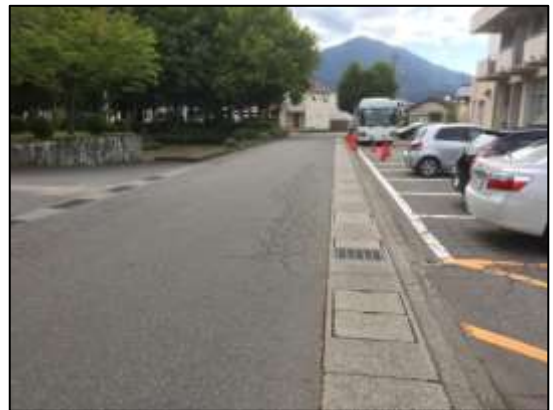
図 1-4 新駅東公園整備予定地（現文化会館敷地）の写真