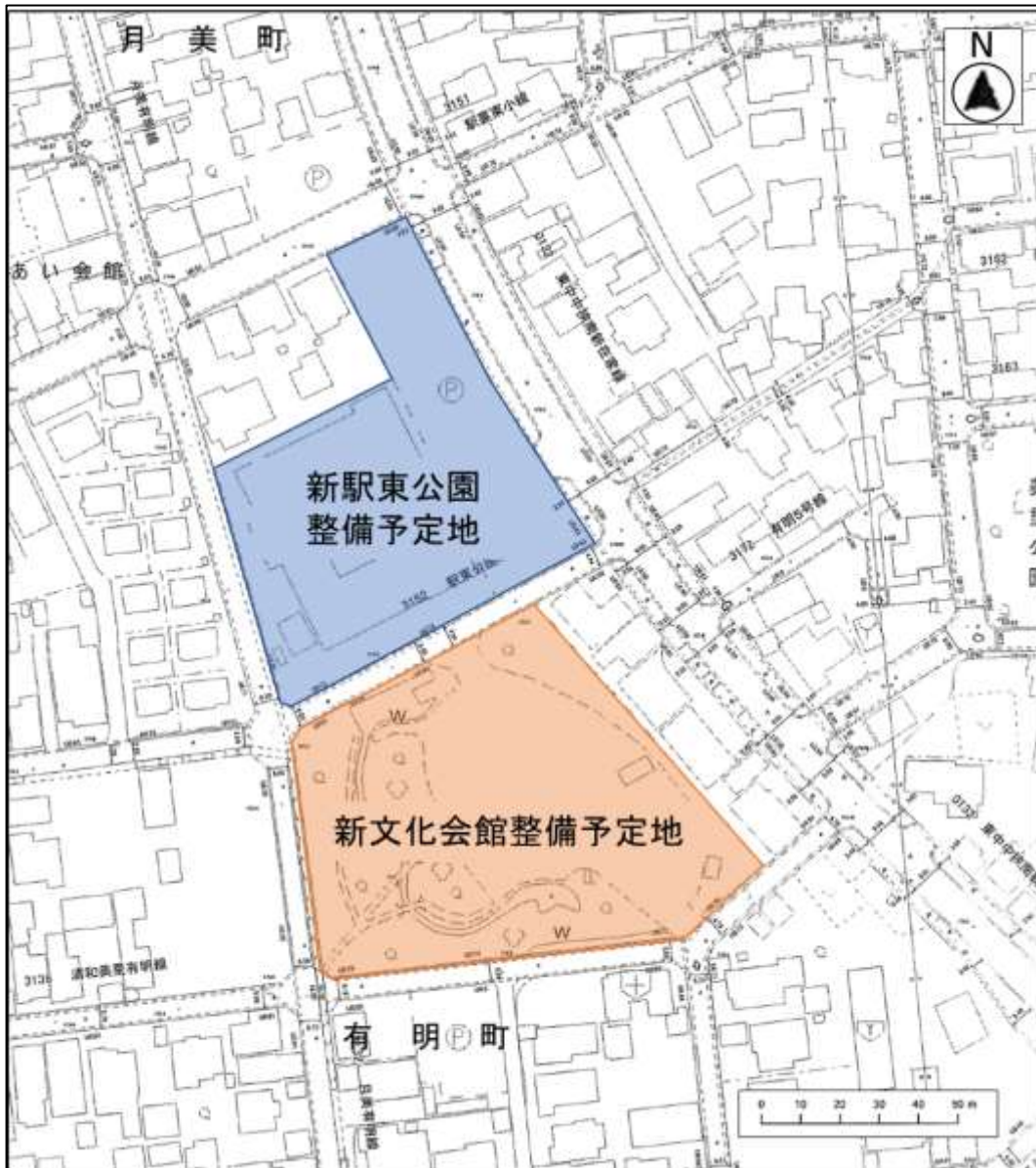
図 1-2 事業予定地の敷地概要