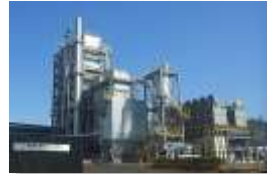
木質バイオマス発電所