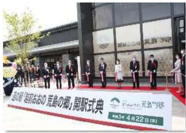
道の駅「越前おおの 荒島の郷」