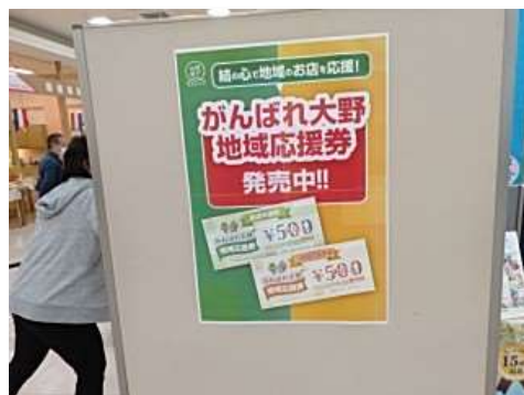
地域応援券の販売