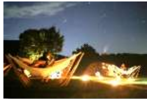
R5年度までの星空保護区の認定を目指す