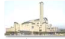
ごみ処理施設 廃熱 (熱利用)