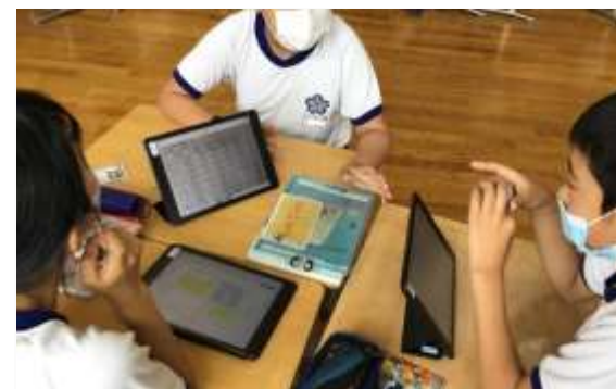
学校へのタブレット端末の導入