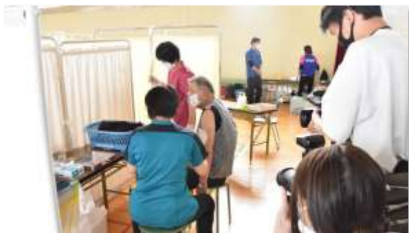
ワクチンの集団接種

ニューノーマル（新たな常態）に適応させるデジタル化や脱炭素といった対策が急速に進みだした。