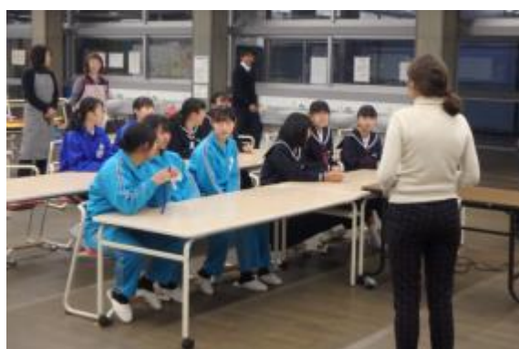
ジュニアリーダー合同研修会

㊦③青少年期においては、地域全体で子どもたちの健やかな成長を育むことができるよう、親子教室などのふれあい交流を図っています。また、中学生と高校生を対象に次代の地域を担うジュニアリーダーの育成に努めています。