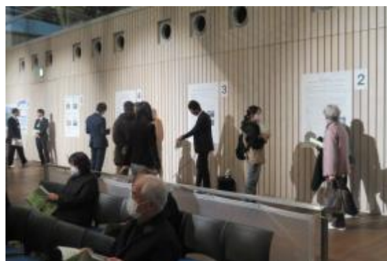
生涯学習フォーラム