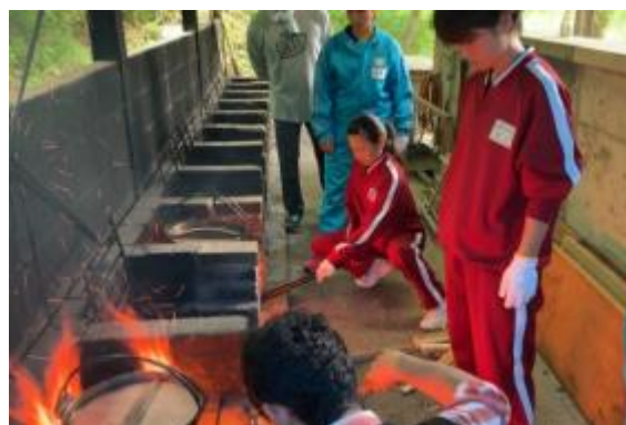
ジュニアリーダーDAYキャンプ