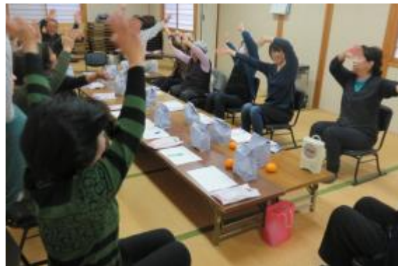
生涯学習人材活用事業