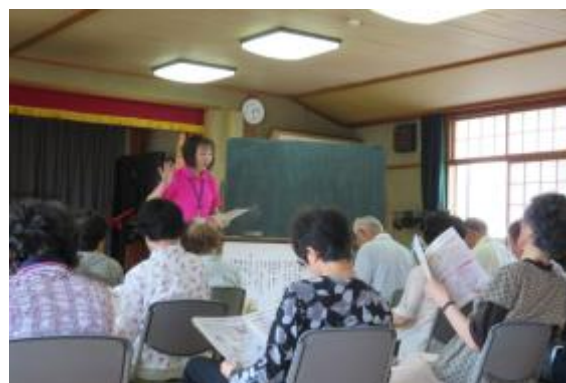
わく湧くお届け講座

※わく湧くお届け講座は、国・県・市政に関する理解を深めていただくために、市民の学習の場に職員を派遣する事業です。