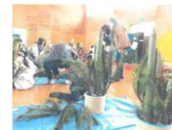
門松づくりの様子

大野長生会では、門松づくりを通して子供たちと共に楽しく交流しました。昔からの風習や手作りのすばらしさを伝え、シニア世代と楽しく話をする事業を12月19日に西部児童センターで25人の参加者で行いました。高齢者がこれまでに習得した知恵やものの考え方を若い世代に伝え、高齢者の生きがいにつながる事業となりました。