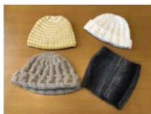
ニット帽等製作例

募集期間 6月1日(火)～8月31日(火) 受付場所 大野公民館 ※製作数量等の関係上、提供いただいた毛糸を本教室で使用できない場合があります。