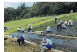
シンバザクラの植栽

大野地区まちづくり推進協議会では、昨年に引き続き亀山東側斜面の美化活動を行いました。大野地区の花いっぱい運動の一環として、8月2日から10月4日まで花壇で植栽するとともに、まちづくりの委員同士の交流の場として行いました。新型コロナウイルス感染拡大防止対策を講じながら可能な作業を行いました。シンバザクラが生育していない部分の植栽を専門家の指導の下に行い、防草シートを設置や樹木の枝切りなど維持管理を含めて実施しました。