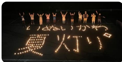
▼9/4 いぬいかわ夏灯り

自薦他薦問いません。中高生の方でもお気軽にどうぞ。とにかく、乾側地区で何か楽しいことができないかと気楽に企画していきます。一緒に楽しみませんか？参加申込は、乾側公民館まで。