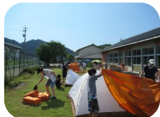
▲7/31-8/1 夏休みキャンプ体験