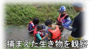
捕まえた生き物を観察