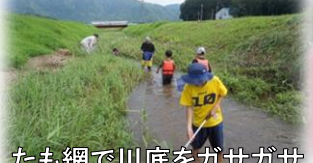
たも網で川底をガサガサ