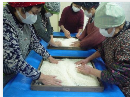
麴を仕込んでいます