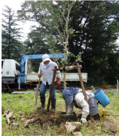
【東勝原区広場サルスベリ植樹 (H23)】