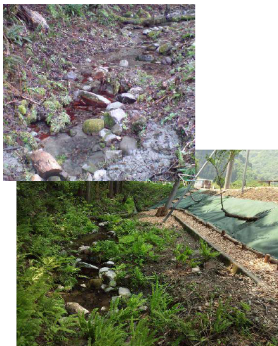
【八幡神社下湧水地の再生 (H22)】

今では雑草が生い茂り、埋もれかけている湧水地や不法投棄されたゴミに汚された用水路に階段や遊歩道を設け、来訪者が清流を楽しめる親水空間として再生するほか、“桃源郷”と表現される花桃並木を核に、地区全体に花が咲き誇る花木の里づくりを、住民協働による故郷の環境保全と位置付け、「豊かな自然を活かした交流人口の増加」を目指し、地区の活性化につなげていくものである。