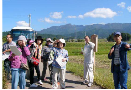
「阪谷の魅力!体験ツアー」の様子

また、10月に「阪谷の魅力!体験ツアー」と題して、1泊2日のモデルコースを実施した。