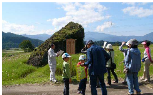
体験メニュー「阪谷岩めぐり」の様子

県内ニーズとしては、日帰りの体験メニューを充実させた方がより効果的であることがわかった。