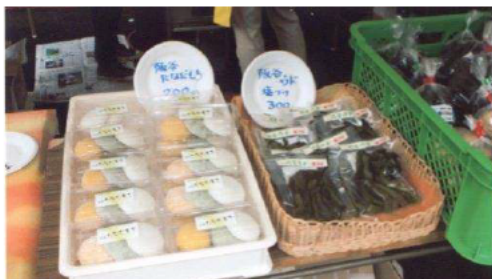
野菜で色付けした餅の販売

また、餅などの既存の加工品についても工夫を凝らし、付加価値を付けた商品として販売を行うことで、販路拡大に貢献した。