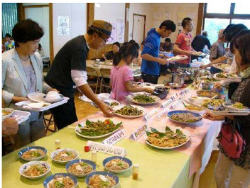
こだわり野菜を食するつどいの様子

有機の里阪谷の魅力を手感できる体験ツアーとして、7月に「こだわり野菜を食するつどい」に合わせて、県内観光会社企画の日帰りバスツアーが開催された。