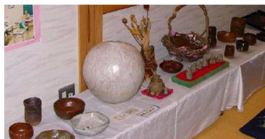
陶芸作品の展示（阪谷地区文化祭）

陶芸室の開催により、陶芸作りの技術が向上した。大野市文化祭や阪谷地区文化祭に作品を出品するなど創作意欲が高かった。