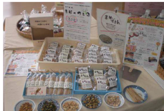
「そばつつえる」「まめずきん」の販売

「加工品の開発」においては、商品化した「そばつつえる」と「まめずきん」を中心に加工品の販路拡大に向け、商談会や各種イベント、物産展に積極的に参加していきたい。