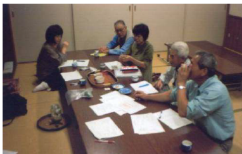
スターランド特産加工部会会議の様子

また、物産展や商談会に参加し、その会場で加工品の試作品のモニタリングを実施した。