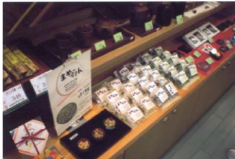
山中温泉の土産店に並ぶ「まめずきん」

商品化した「そばつつえる」「まめずきん」を中心に阪谷の農産加工品が、広く知られるようになった。「まめずきん」は、石川県山中温泉の土産店の依頼を受け、新商品を開発し、販売することとなった。