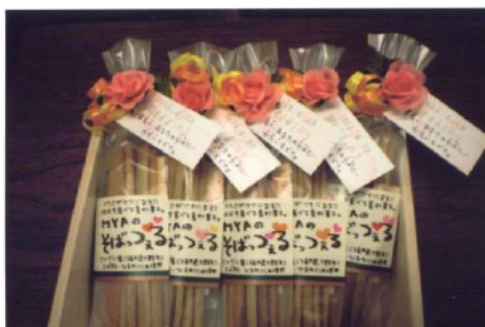
結婚式用にラッピングされた「そばつつえる」

昨年度、商品化したそば菓子「そばつつえる」では、結婚式用プチギフトとしてラッピングを工夫し、販売した。また、大豆のお菓子「まめずきん」では、きな粉、黒糖、青海苔の3種類に加え、胡麻、塩味の商品を新たに開発し、販売した。