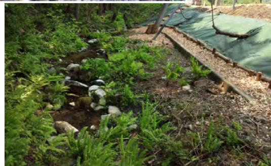
【八幡神社下湧水地の再生 (H22)】