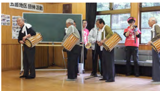
神子踊り披露 (神子踊り保存会の皆さん)