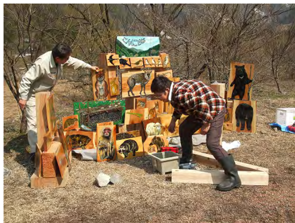
青空ギャラリーを創作する地区住民の方々