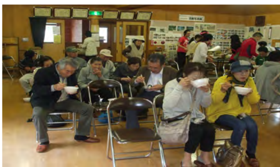
地区住民手作りの「ふるまい鍋」

今後も地区の“宝”である、花桃を核とした取組みを継続し、住民と来訪者が交流する機会や場を充実することで、そこから生じる賑わいが“ふるさと五箇”の活力となることが期待される。