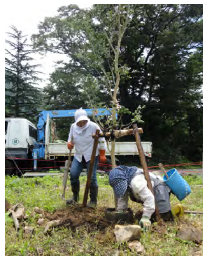
【東勝原区広場サスバリ植樹 (H23)】

平成22年度から3年間の「越前おおの地域づくり交付金事業」では、住民協働による故郷の環境保全と交流人口の増加による地域の賑わいづくりをテーマとし、雑草が生い茂り、埋もれかけた湧水地や不法投棄されたゴミに汚された用水路に階段や遊歩道を設け、来訪者が清流を楽しめる親水空間として再生した。さらに、“桃源郷”と表現される花桃並木を核に、地区全体に花が咲き誇る花木の里づくりにも取り組んだ。