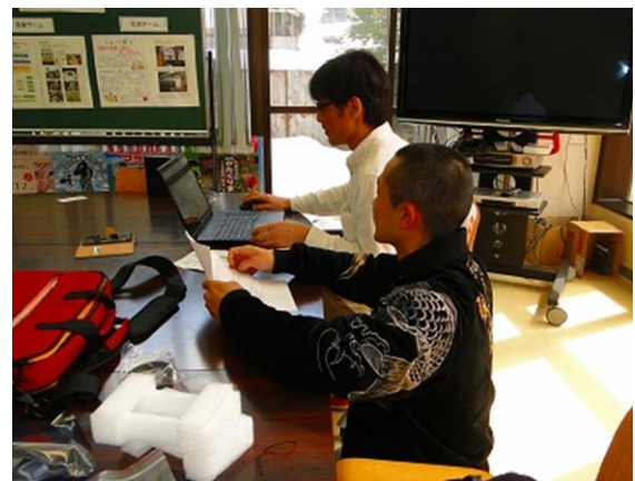
「和泉自治会」のHP作成