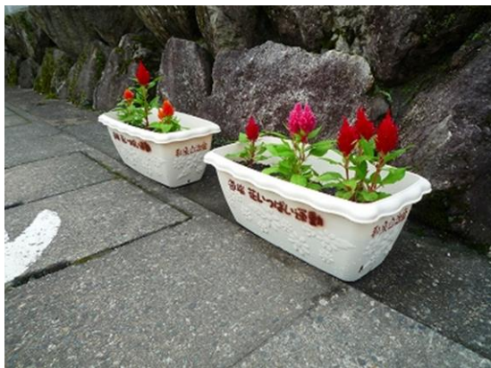
道端のプランター

越前おおの・九頭竜花桃回廊プロジェクトにあわせて、地域を花でいっぱいにするを目的として実施した。各世帯や事業所にプランターを貸出し、普段の生活で行き来する家の前の道路脇に花を咲かせた。