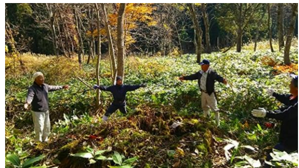
地区内の名所めぐり

くため、それらを記録し情報発信をしていくパソコン機器を整備した。記事はチーム会議で内容の検討や資料の収集、またメンバーをはじめ地区の有志を募り実際に現地に出向き、地区の名所めぐりを行った。この記録を広く住民に公表することで、地区への帰属意識を高め、また地区外に発信していくことで、和泉地区を広く知ってもらえるものと思われる。