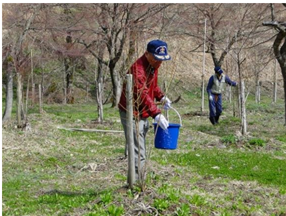
花桃の育成管理（追肥作業）