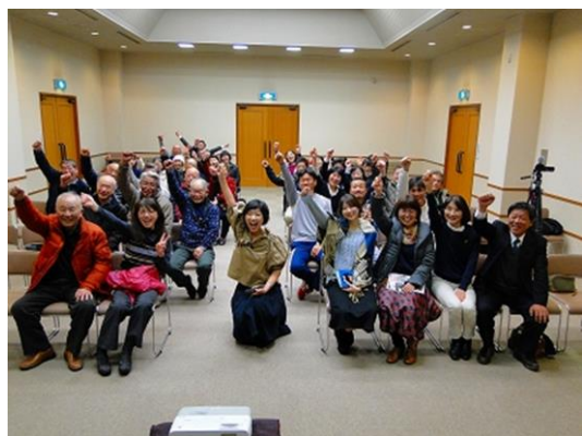
地域づくり講演会の様子