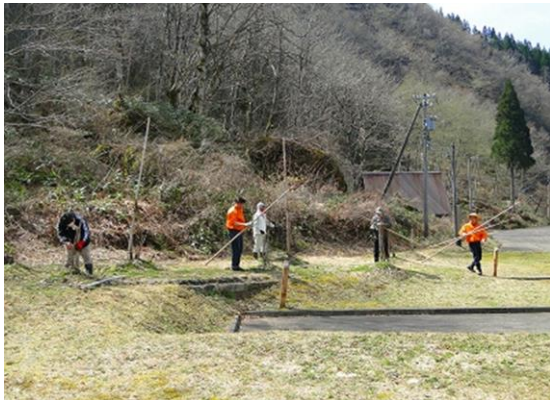
花桃の育成管理（雪囲い作業）

また、将来この地域が花桃でいっぱいになり、多くの人にこの地を訪れてもらえることに思いをさせている。