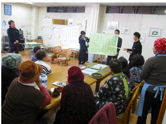
和泉中学校「総合学習」の発表

「人、伝統・文化チーム」は、地区の人口減少により和泉地区が誇る伝統行事などが途絶えないよう、また和泉の地域資源（自然・名所等）とあわせて次世代に継承してい