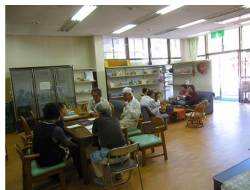
「より処」日頃の様子