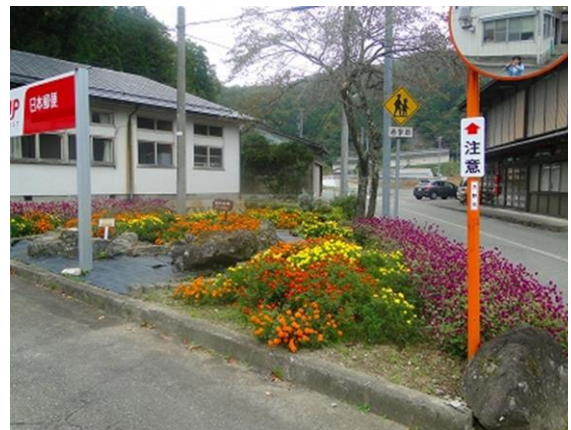
「道端花いっぱい運動」の花壇