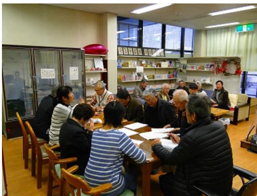
花桃実行委員会の会議