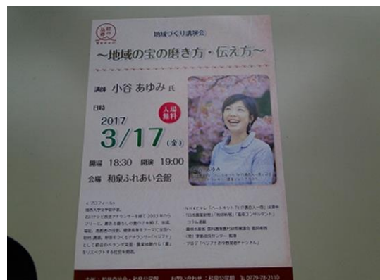
地域づくり講演会

また、公民館近くの花壇に花を植え、草むしり等を住民各自が自主的に行うなど、環境美化に関する意識が高まった。