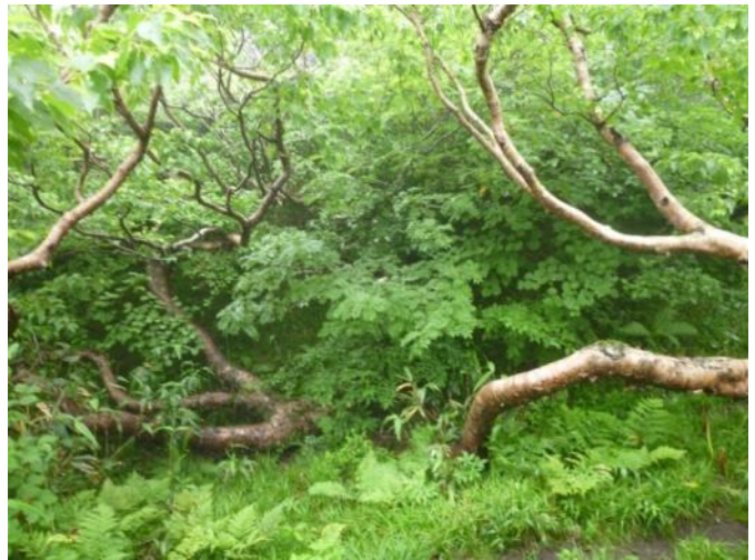
ダケカンバ（頂上台地 1,400m 付近）