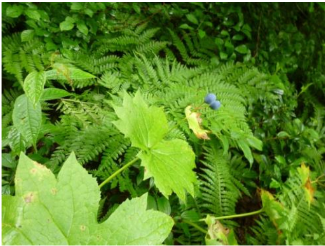
サンカヨウ（標高 1,300m 付近）【市注目植物】