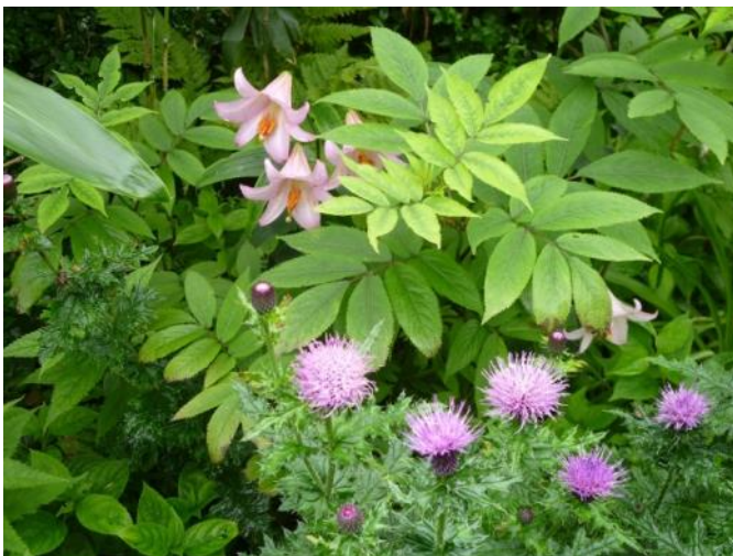
ササユリ、アザミ（頂上台地 1,400m 付近）