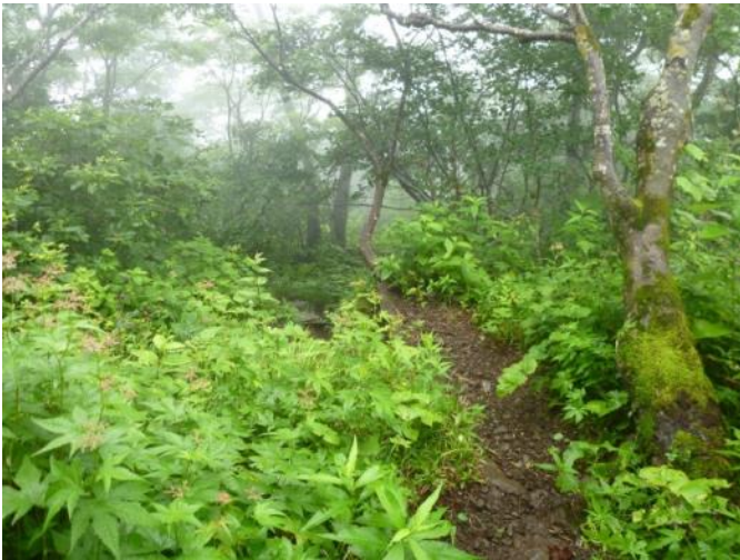
ブナ林【保安林】（標高 1,250m 付近）