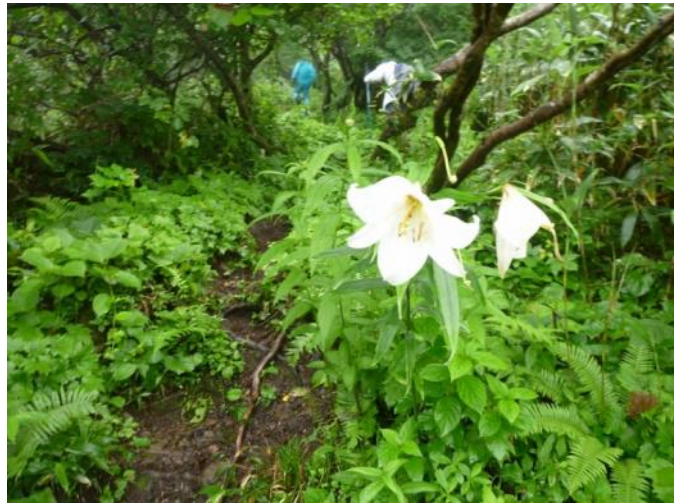
ササユリ（標高 1,300m 付近）