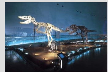
恐竜等の観光資源を軸とした観光地の形成、活性化