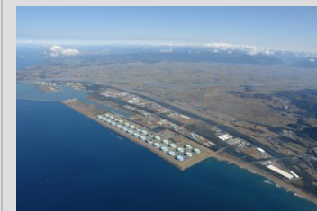
素材産業等の集積を基盤とした技術交流が生み出す成長ものづくり