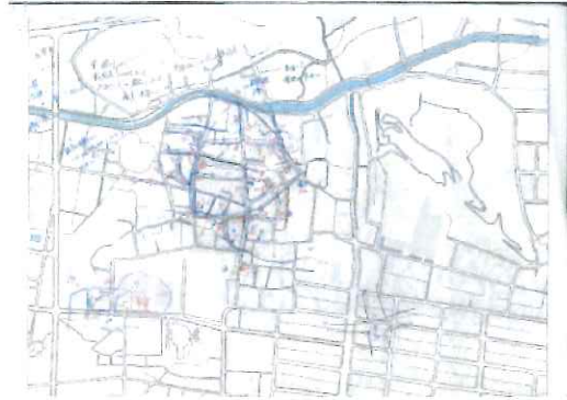
水路の分布と幅を書き込んだ地図

まず大野の街を歩くと必ず目にする事ができる水路に着目し、その分布と幅を地図 に書き込み、種類や活用のされ方をヒヤリングした。