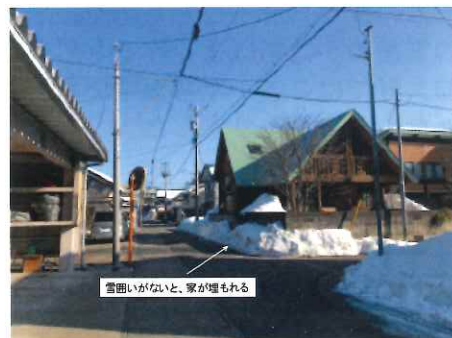
雪囲いがないと、家が埋もれる

冬の景観づくり 例えば、「雪囲い」 色や素材などがバラバラで景観に統一感がない 新しい家にはないこともある 古い家では長年の使用で壊れることも このスタジオにもなく、危険！ 色が目立つ色だと、それだけが浮いてしまう。