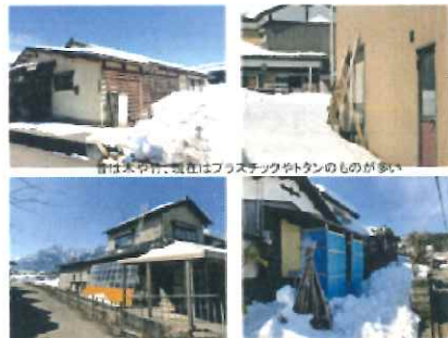
昔は木や竹、現在はプラスチックやトタンのものが多い

右写真は、雪囲いがない家。 地元の方とお話をした際に、 雪囲いがないと、雪が落ちてきて、 そのまま家が埋もれてしまう と話を聞きました。