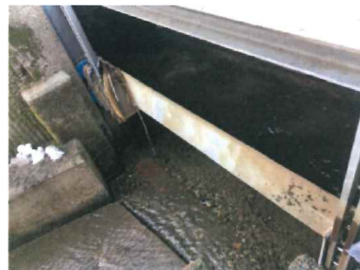
水の順路を分ける水門

もう一つは雪かき後の雪を落とすために作られた流雪溝と呼ばれるものである。幅は50cm~80cmほどのものが多く、赤根川から引いてきた水が道の両側に沿って通っている。水路が交わる十字路などでは水門を使って水の順路を分けている。金属格子のふたは自由に開閉できるようになっていて、市民の方々が主体的に雪かきをしている様子が伺えた。そこでは雪かきソリの下に滑りを良くするために雪を敷くなどの工夫も見られた。