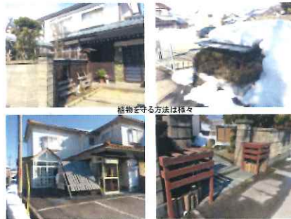
植物を守る方法は様々