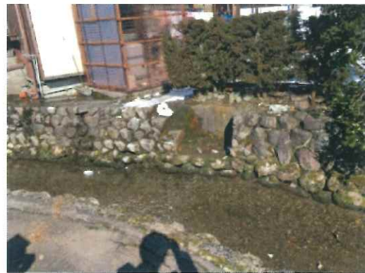
集落地を流れる湧水路 洗濯できる場所

一つは地下からの湧水を利用したもので、古くから残っているものが多く、幅は約3mほどで、透き通った水が流れている。所々に水面へ降りられる階段と踊り場のようなものが備え付けられており、綺麗な水と、水温が年中を通して15度という暖かさのためから、昔はそこで赤ちゃんのおしめなどを洗濯するのに使われていたという。現在ではあまり利用されておらず、湧水路は雪かき後の雪を落とすのに使われている。農機具などを洗っている人はいるようだ。(集落地に多数あり)