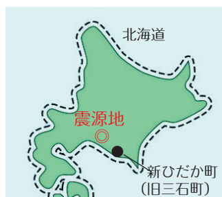
震度5強を観測した新ひだか町