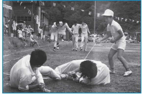
大納小中合同体育大会：昭和45年撮影

大納小中合同体育大会で二人三脚が行われている様子です。息を合わせて走らないといけない難しい競技に、さらに縄跳びをしながらゴールを目指しています。