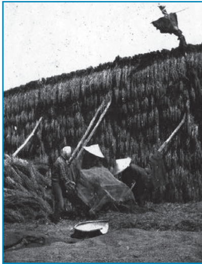
ハサバの様子：昭和10年撮影

大きなハサバに、いっぱいのお米が干されている様子です。ハサバの一番上にあるかかしは、お米を食い荒らすスズメを追い払うためのものと思われます。