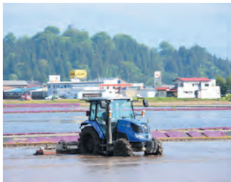
大野に咲く二度目のサクウ!

編集後記 5月上旬、市内のあちらこ ちらでシバザクラが満開を迎え ました。農作業が本格的に動 き出すこの時期、代かきをす るトラクターに寄り添うよう に、愛らしい姿で私たちの目を 楽しませてくれます。 来年のゴールデンウィークは 10連休になる予想もされてい て、このシバザクラを見に、多 くの観光客に来てほしいです ね。