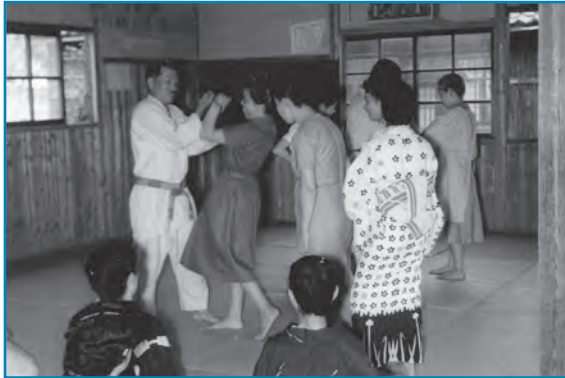
護身術の講習：昭和33年撮影

大野公民館で、護身術の講習が行われました。参加者は身近な防犯のために、護身術の型を実践しながら真剣に取り組んでいます。