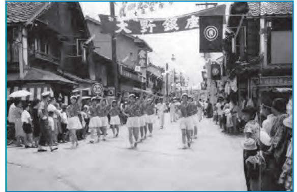
大会記念パレード：昭和39年撮影

第5回日本体操祭大野大会に合わせて行われた記念パレードの様子です。有終西小学校から有終南小学校まで、バトンガールや鼓笛隊が華やかに行進しました。