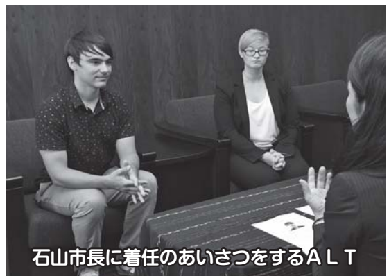
石山市長に着任のあいさつをするALT