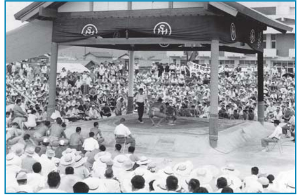
福井国体(相撲競技)：昭和43年撮影

福井国体において、大野市宮相撲競技場で相撲競技が開催されました。多くの観衆の視線が注がれる中、取組が行われている様子です。