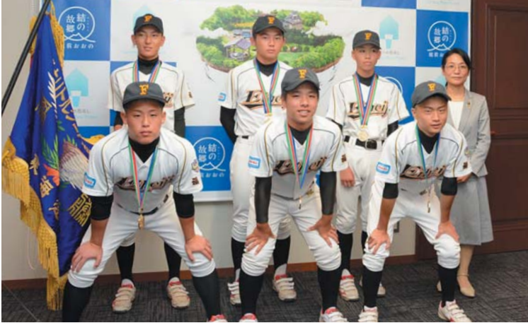
7月25日訪問、中学硬式野球リトルシニア日本選手権大会に出場する福井永平寺リトルシニア所属の本市出身選手の皆さん

各大会の地元大会を勝ち抜いて、全国大会へと駒を進める皆さん。市長を表敬訪問し、全力を尽くすと約束しました。