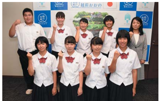
8月13日訪問、全国中学校体育大会に出場する陽明中学校の相撲、バドミントン選手の皆さん