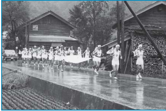
福井国体(旗リレー)：昭和43年撮影

第23回国民体育大会秋季大会を間近に控えた9月26日、九頭竜ダムを出発した聖炎旗を引き継ぎ、中竜鉱業所従業員がリレーしている様子です。