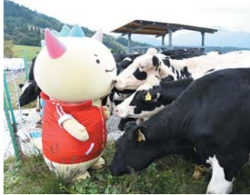
モーすぐだぬ。福井国体