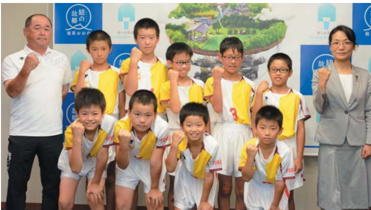
7月25日訪問、全日本バレーボール小学生大会に出場する上庄キッズバレーボールスポーツ少年団の皆さん