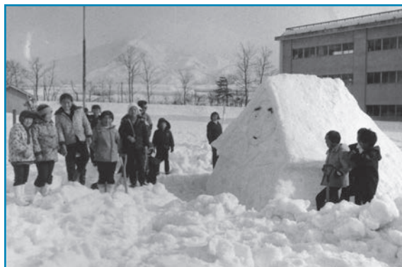
雪像づくり：昭和49年撮影

富田小学校PTA親子学級で雪像づくりをしたときの様子です。学年ごとにいろいろな雪像がつくられました。この学年の雪像は雪人形のようなのです。