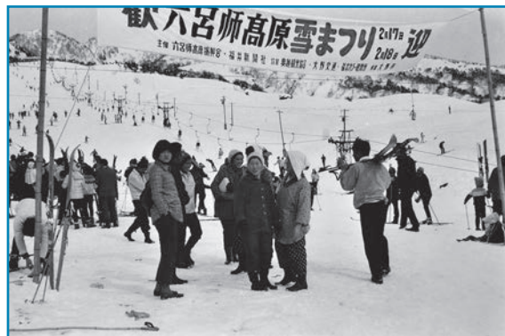
六呂師高原雪まつり：昭和43年撮影

六呂師高原雪まつりの様子です。ゲレンデにかかるリフトはスキーヤーでいっぱい、会場は多くの人でにぎわっています。