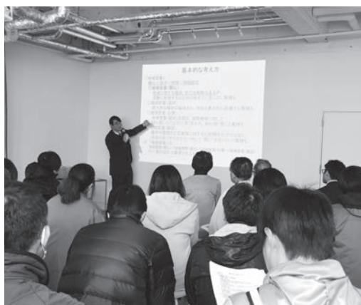
昨年開催された同報告会の様子