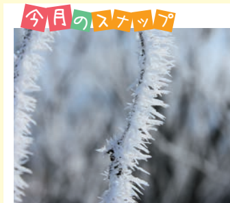
真冬に咲く「氷の花」