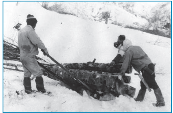
一本ソリを使った運搬作業：昭和38年頃撮影

一本ソリは冬期間に山で切り出された木材の運搬に使用されました。重機が入れない山でも作業が可能で、少人数でも数本の丸太を運搬することができました。写真は和泉地区で一本ソリを滑らせながら運搬している様子です。