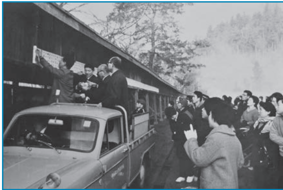
合格発表：昭和50年頃撮影

多くの受験生や保護者が集まった大野高校の入学試験の合格発表です。写真は職員がトラックの荷台に乗って合格発表の紙を貼り出している様子です。