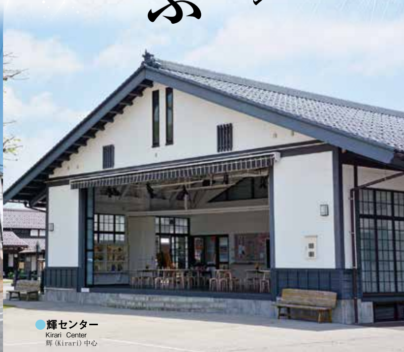
●輝センター Kirari Center 辉 (Kirari) 中心