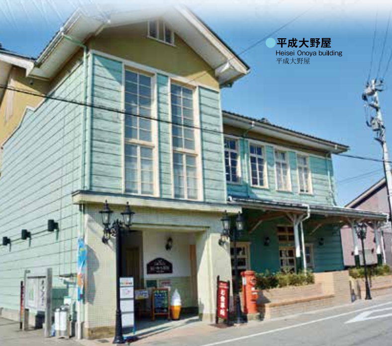
●平成大野屋 Heisei Onoya building 平成大野屋