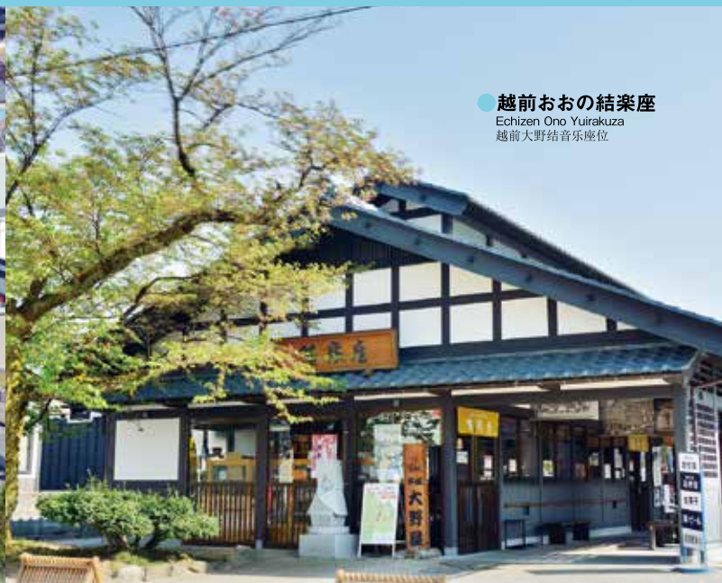
●越前おおの結楽座 Echizen Ono Yuirakuza 越前大野结音乐座位