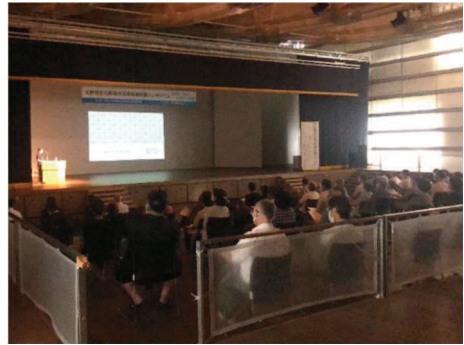
文化財シンポジウムの様子