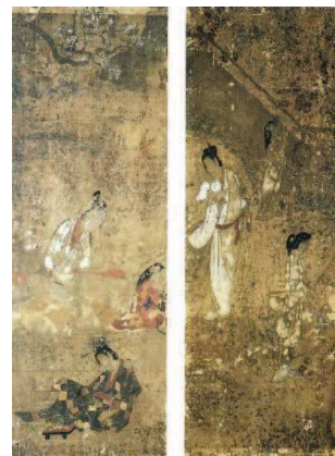
紙本着色 春秋遊女遊楽図