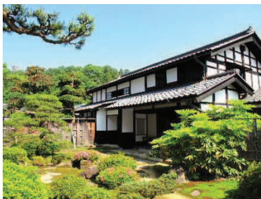
旧内山家住宅主屋