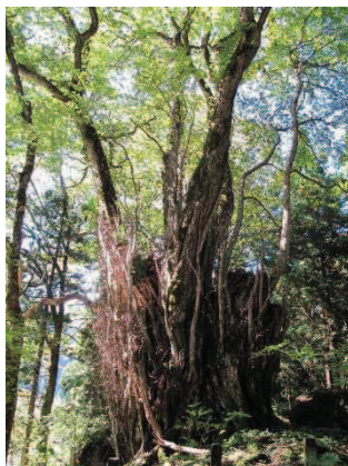
白山神社のカツラ