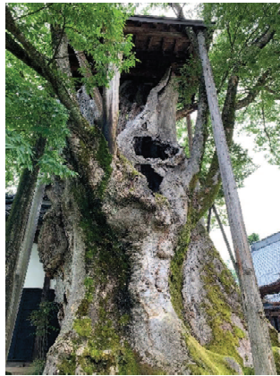
専福寺の大ケヤキ