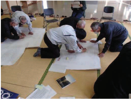
ワークショップ（阪谷地区）の様子