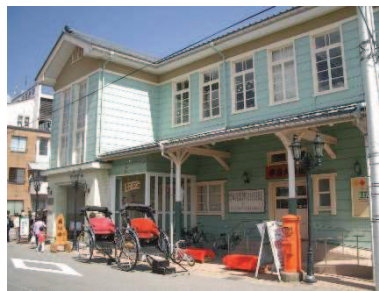
平成大野屋本店洋館