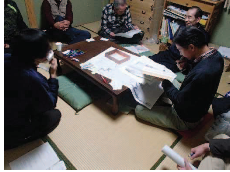
市民活動グループとのワークショップの様子