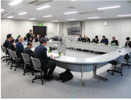
第1回策定協議会開催の様子