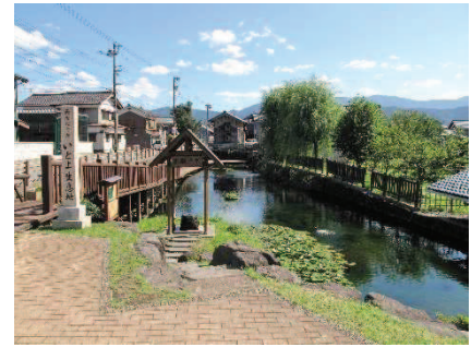
本願清水イトヨ生息地